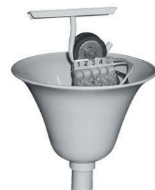
detail zavěšení s izolátorem chvění, závěs je vhodné doplnit o pojistné lanko