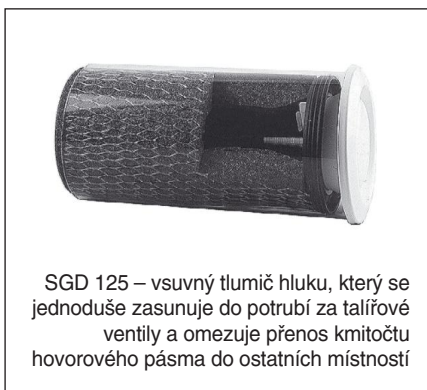
SGD 125 – vsuvný tlumič hluku, který se jednoduše zasunuje do potrubí za talířové ventily a omezuje přenos kmitočtu hovorového pásma do ostatních místností