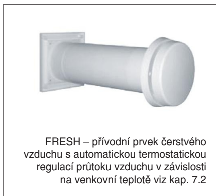
FRESH – přívodní prvek čerstvého vzduchu s automatickou termostatickou regulací průtoku vzduchu v závislosti na venkovní teplotě viz kap. 7.2

se provádí 4-mi šrouby na stěnu nebo strop. Otvory jsou na zadní stěně a mají Ø 5 mm. Podle požadovaného počtu sacích hrdel se odstraní přebytečné záslapky.